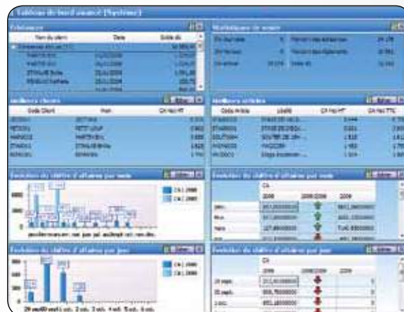
Le tableau de bord totalement personnalisable

Personnalisez vos propres tableaux de bord pour visualiser synthétiquement les indicateurs clés de performance de votre choix. Profitez également de plusieurs modèles de tableaux de bord pré-paramétrés (évolution de CA mensuel, annuel, meilleurs articles, clients...) que vous pouvez personnaliser par utilisateur.